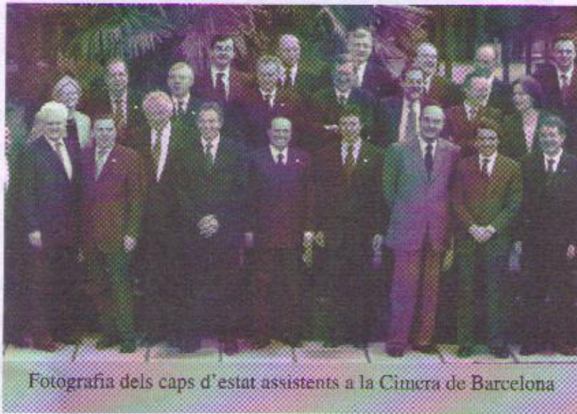
Fotografia dels caps d'estat assistents a la Cimera de Barcelona

I per aquest carro amb tants pals a les rodes han creat una burocràcia espectacular que costa un diner indecent. Jo penso, i no crec equivocar-me, que el que es podria estalviar cada semana a UE amb una estructura raonable, podria resoldre en gran manera els coneguts problemes del tercer món, setmana a setmana, país a país.