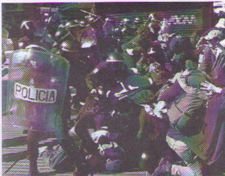
Resposta de la policia a les manifestacions antiglobalització

En paral·lel a les reunions dels Caps d' Estat hem vist al carrer tot un espectacle de manifestacions de tota mena, que reflecteixen, sobre tot, descontentament. La gent vol més coses i no té idea de com es poden aconseguir.