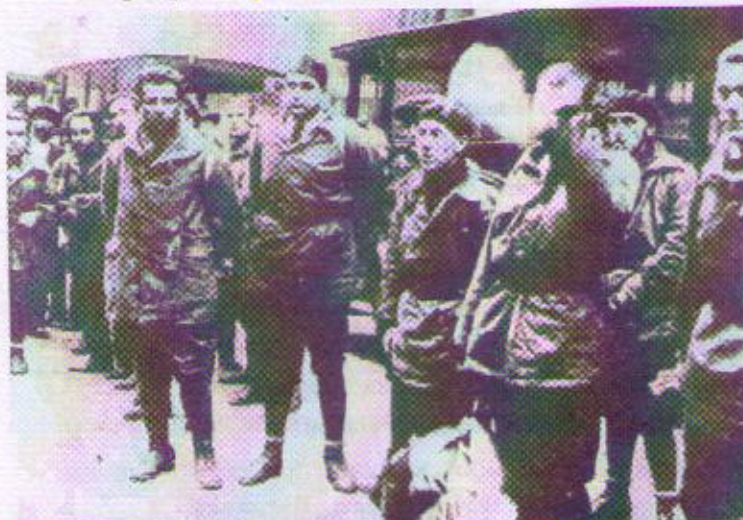
Imatge dels fets de Prats de Molló l'any 1926

És en aquest sentit que nosaltres voldríem recuperar tres personatges, que serien un exemple paradigmàtic d'aquesta situació d'oblit històric.