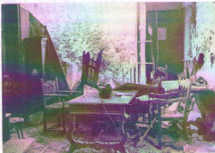
Interior de l'edifici del CADCI després de la tràgica nit