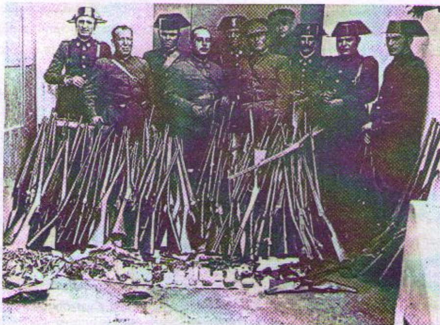
Membres de la guàrdia Civil amb les armes incautades el 6 d'octubre

Per això en ésser requerit per a escriure aquestes ratlles m'ha semblat el més digne d'ell fer aquesta breu descripció del record inesborrable que en conservo.