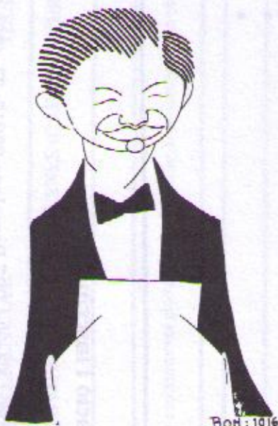
Marià Manent Vist per "Bon" (1916)