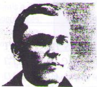
De dalt a baix, Pi i Margall, Valentí Almirall, el Doctor Robert i Jacint Verdaguer.

De 1903 a 1932 han canviat moltes de les persones però tot allò que les motivava, les il·lusionava i donava coherència als seus actes es manté amb variacions escasses: l'ideari que els socis del CADCI tenien en comú, amb independència de la seva filiació política, de la seva adscripció sindical o de les seves conviccions morals i religioses.