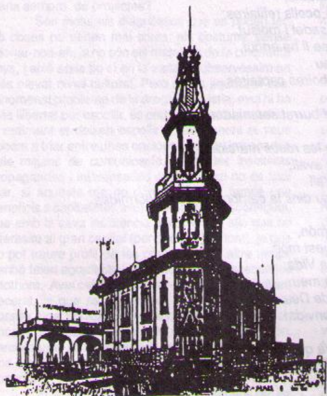
Perspectiva del futur CASAL DE MAR del « Centre Autonomista de Dependents del Comerç i de la Indústria »