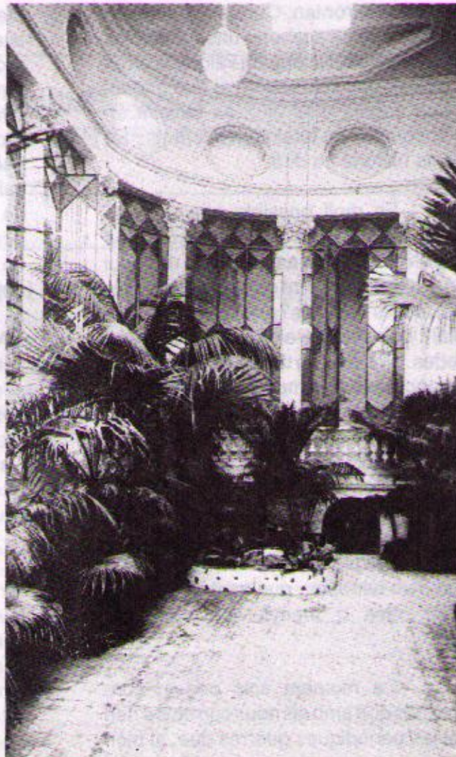
Vestíbul del nostre edifici any 1915