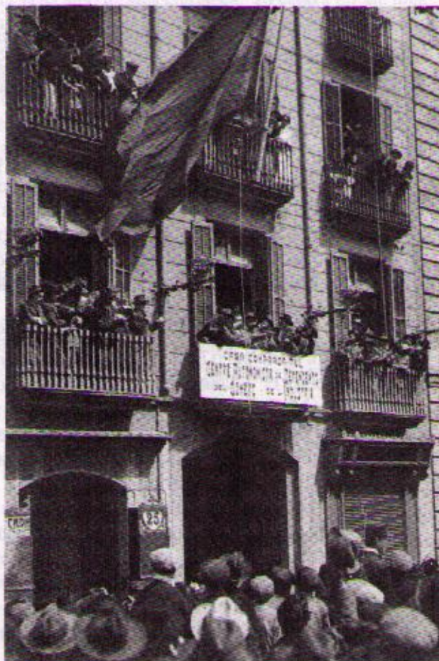
Inauguració Oficial Casal CADCI 8-5-1915